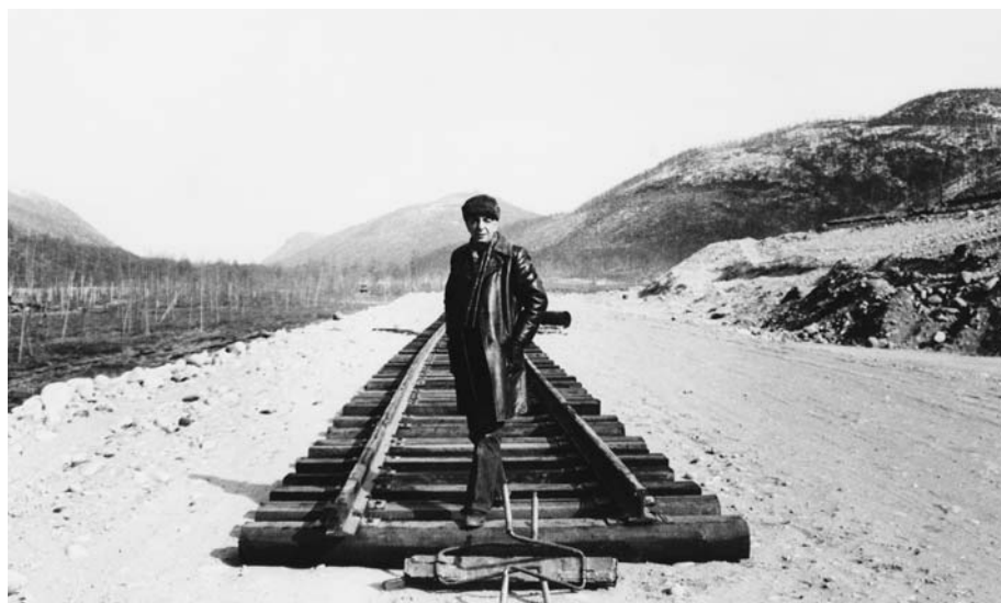
БАМ. Это и правда похоже на край света.