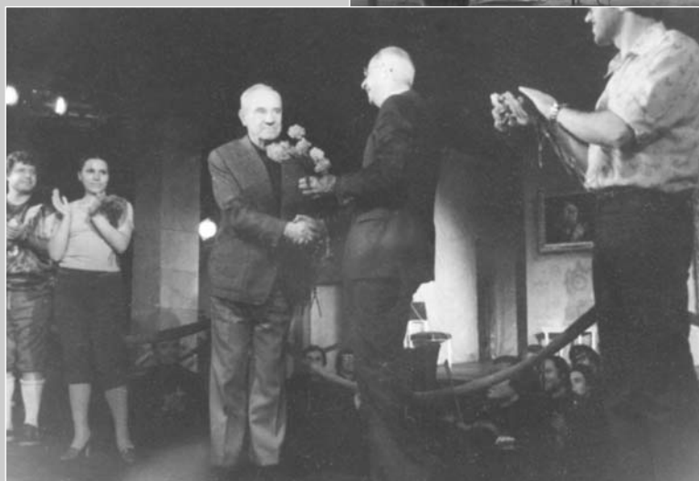
“Граф Калиостро” – и правда очень веселая опера.