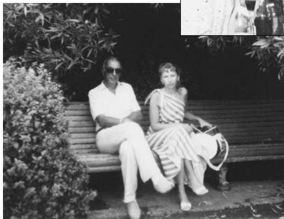
Сухуми. 1990 год.