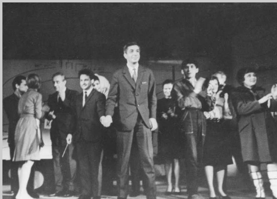
“Кто ты?” – опера для молодых, которую делали молодые.