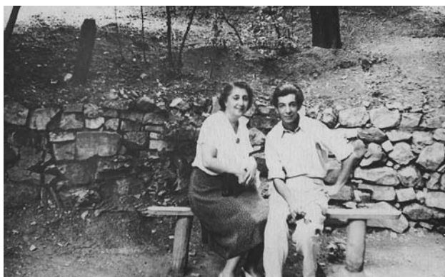
С мамой на отдыхе в Кисловодске.