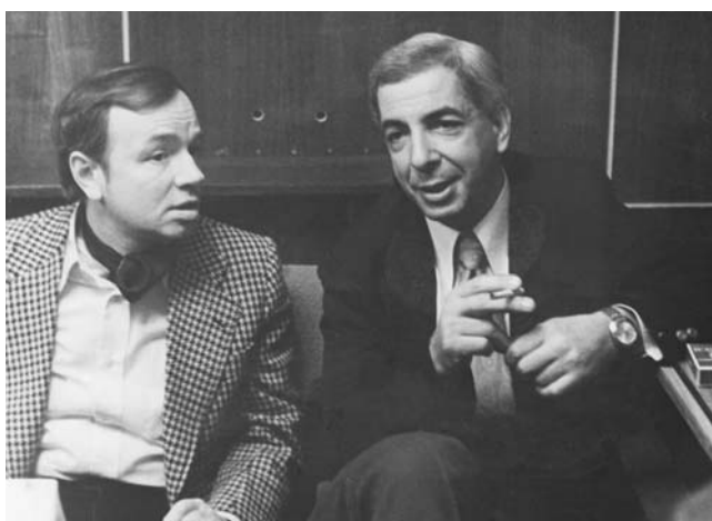
Андрей Вознесенский – Микаэл Таривердиев. Типичный ракурс непрерывающегося диалога.