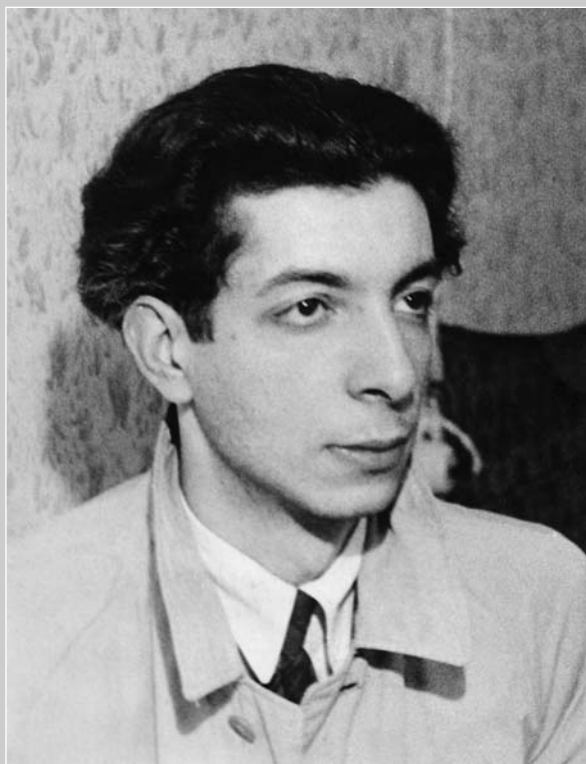
Студент, ученик Арама Хачатуряна.