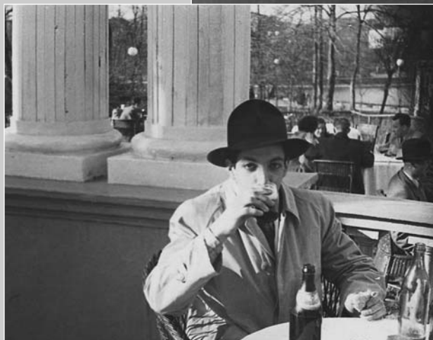
Шляпа, купленная на первый гонорар.