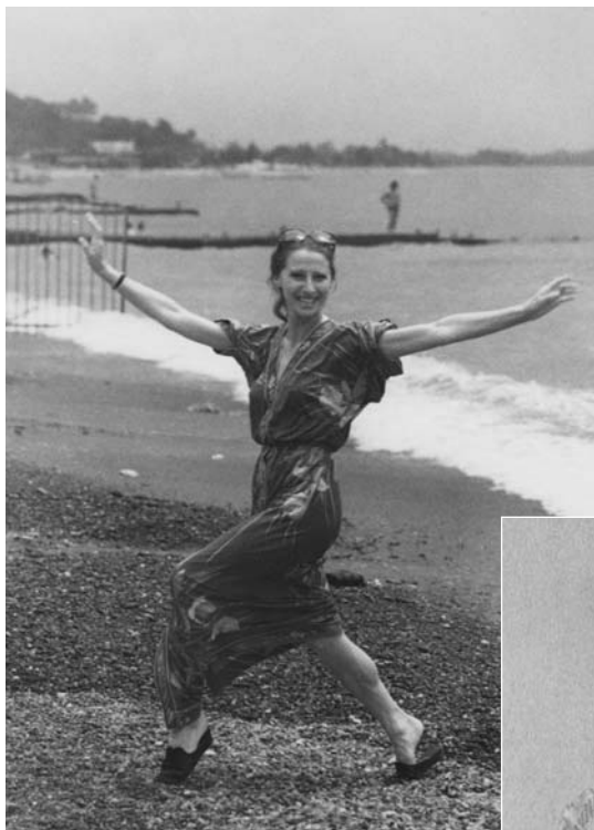
Майя Плисецкая – такой увидел ее через объектив фотоаппарата Микаэл Таривердиев.