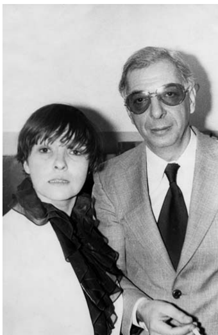
С Беллой Ахмадулиной.