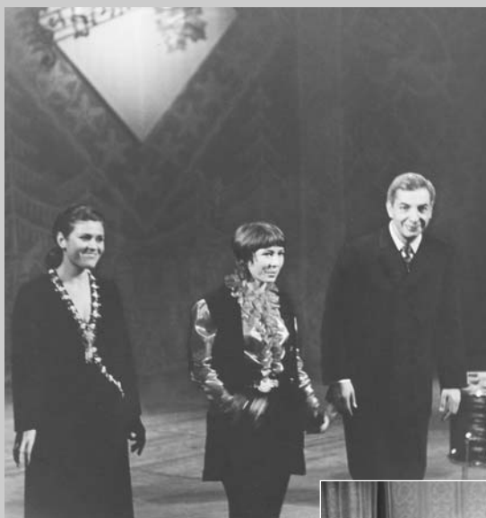
Разные концерты, разные исполнители. С Еленой Камбуровой и Валентиной Толкуновой.