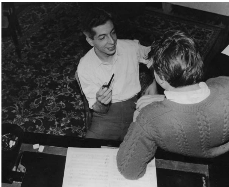
Вот еще когда было положено начало коллекции трубок!