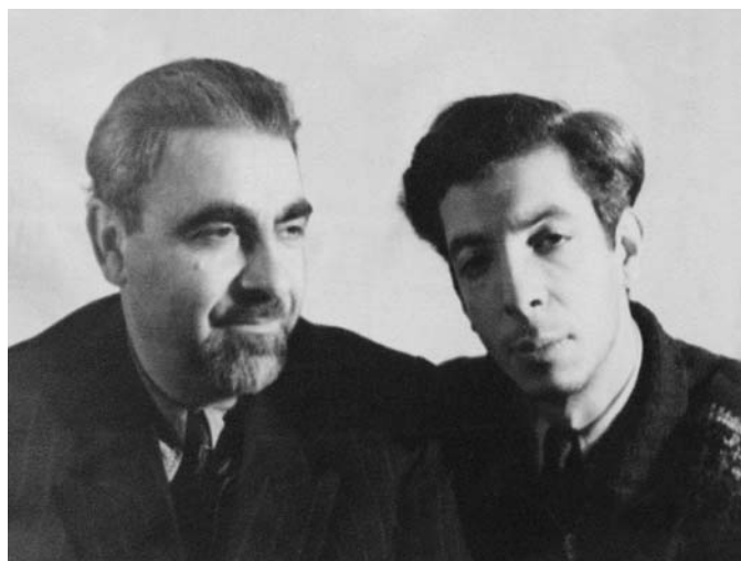
Первая встреча с отцом после его возвраще- ния из тюрьмы.