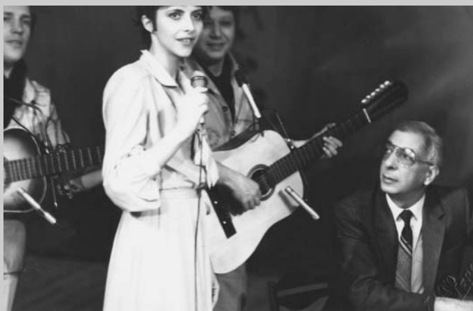
С трио “Меридиан”.