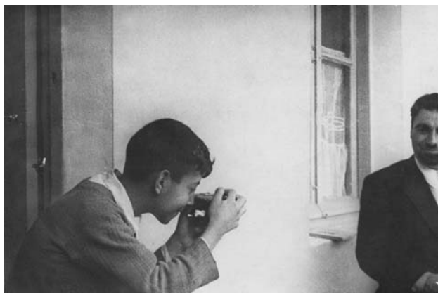
Первый в жизни фотоаппарат.